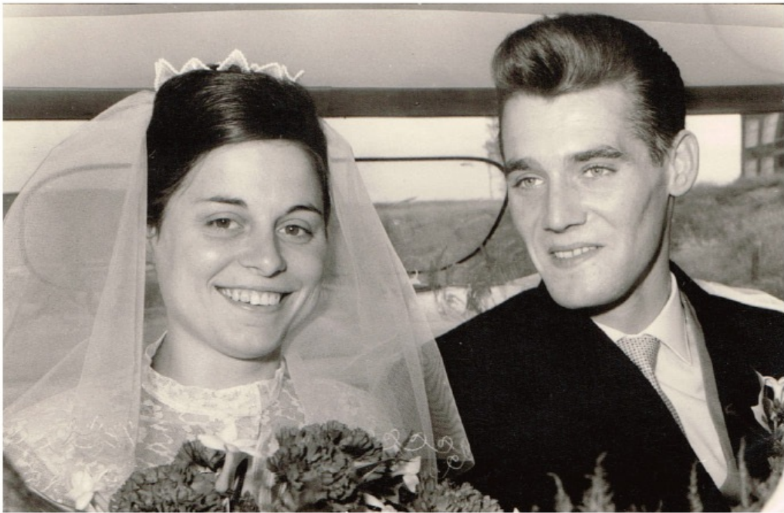
Trouwfoto. Schiedam, 11 juli 1962