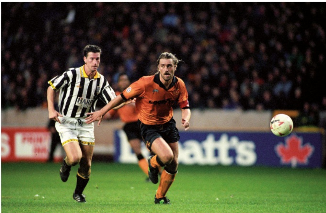
Wolverhampton Wanderers tegen Notts County