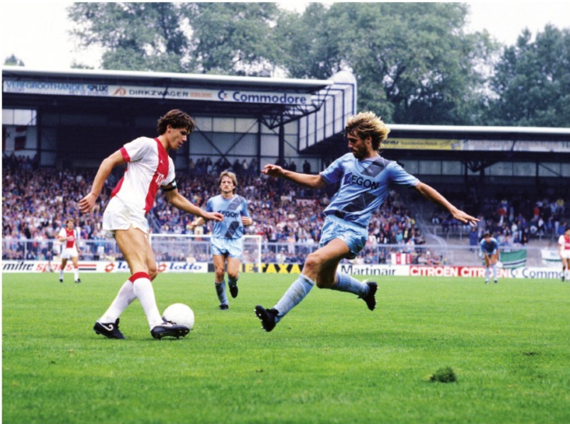
Rotterdammer in Groningen