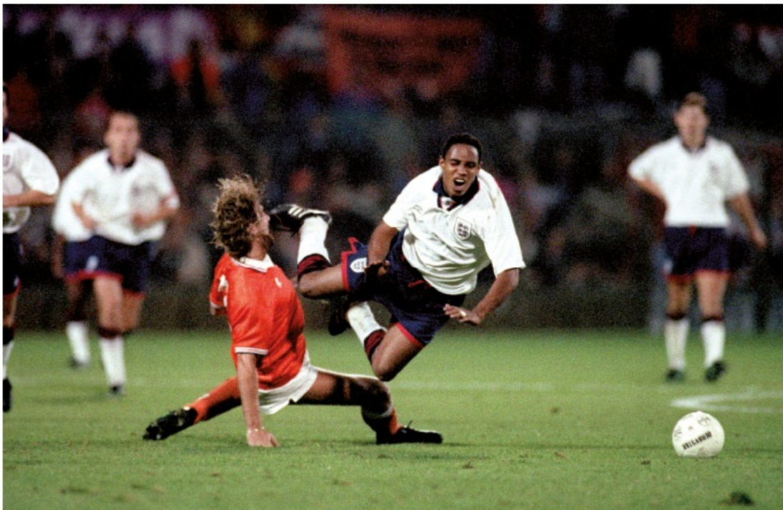
In de basis tegen San Marino