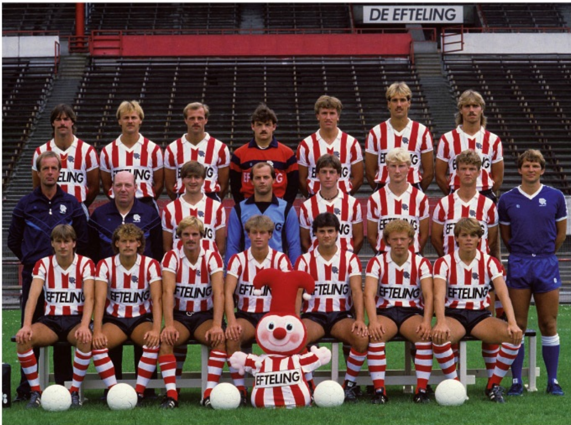
In de verdediging van Sparta