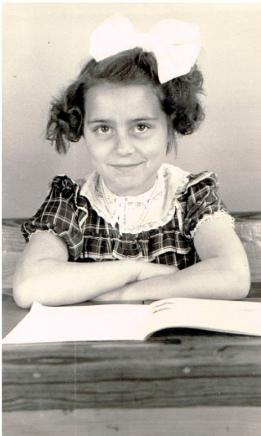
Moeder Mar in de schoolbanken