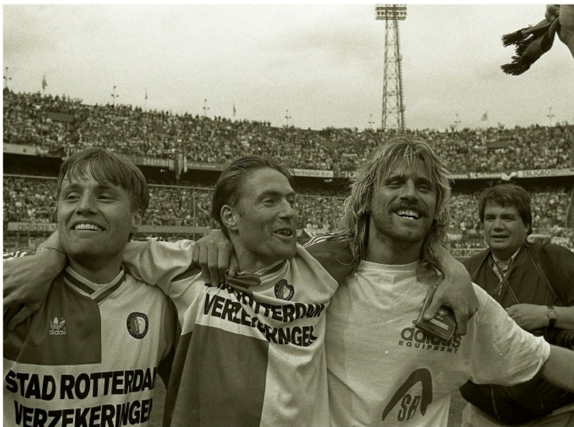
Seizoen 1990-1991 tegen FC Groningen in De Kuip