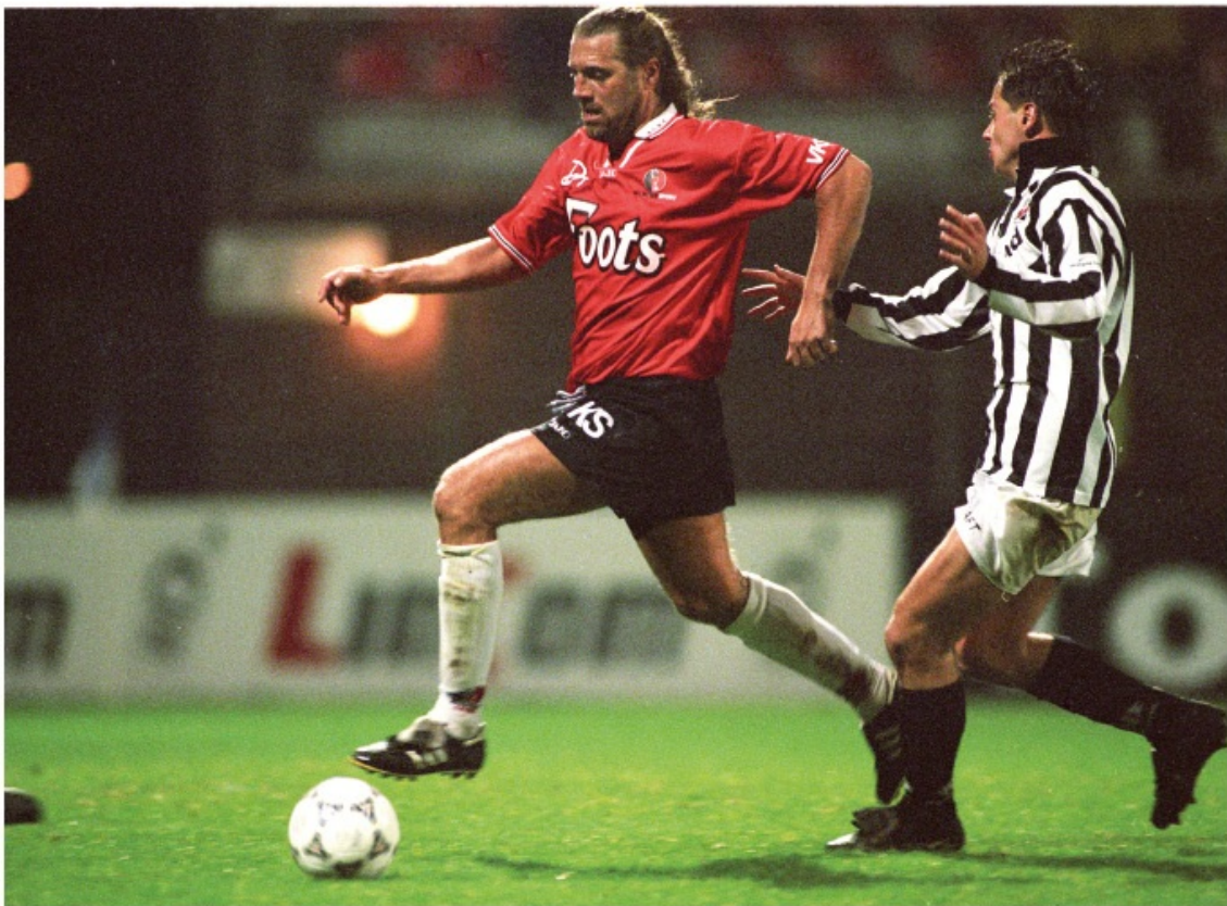
Terug in Nederland, bij vvv